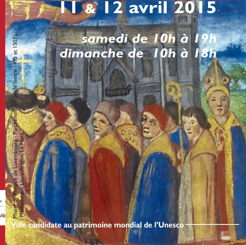
Missel de Philippe de Luxembourg - Parchemin, XV e siècle (entre 1495 et 1503) Médiathèque Louis-Aragon, Le Mans

Salon du livre ancien 11 & 12 avril 2015