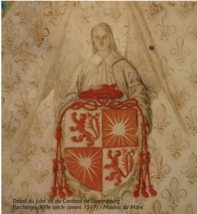
Détail du Jubé dit du Cardinal de Luxembourg Parchemin, XVI e siècle (avant 1519) - Musées du Mans

création graphique et maquette : P. Geslin/O. Châble - impression : imprimerie communautaire - ne pas jeter sur la voie publique