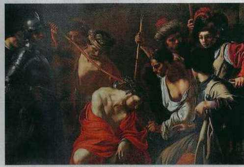
« Le Couronnement d'épines », tableau de Manfred récemment restauré, est présenté au musée de Tessé. À découvrir à 17 h 30, samedi et dimanche.