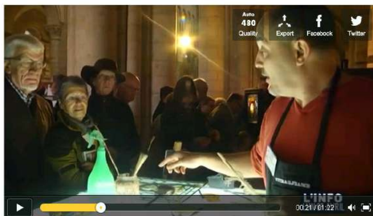
3e édition de Mans'art (Le Mans)

http://www.dailymotion.com/video/x1odubj_3e-edition-de-mans-art-le-mans_creation