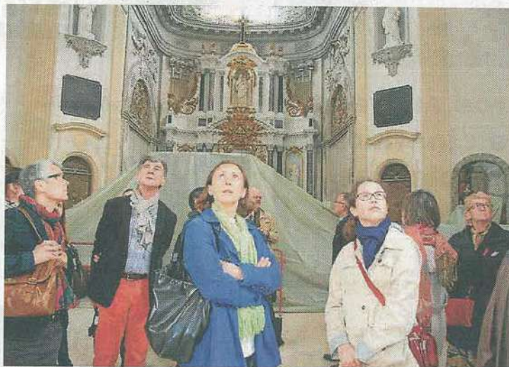
L'église de la Visitation en travaux a attiré près de 120 Manceaux, venus la découvrir ce week-end.

Prochaines dates de la 4 e édition des Journées Mans'art, les 12 et 13 avril 2015.