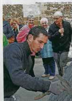
À l'extérieur de la cathédrale, les artisans du bâti en démonstration.

Accès libre et gratuit de 10 à 19 heures (de 12 à 18 heures pour la cathédrale). Navette hippomobile l'après-midi seulement.