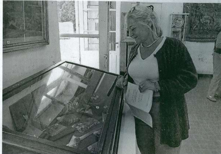
Chaque commissaire-priseur proposera 40 lots d'objets à la vente aux enchères.

Ce samedi , de 14 h 30 à 18 h, vente publique aux enchères à la collégiale Saint-Pierre-la-Cour. 120 lots sont proposés et visibles ce samedi matin de 10 h à 12 h 30. L'entrée est libre et gratuite.