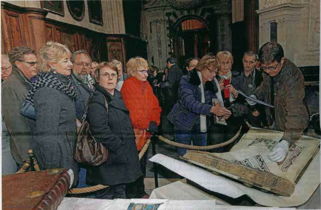
Le Mans, hier. La cathédrale a sorti l'un de ses trésors : quatre graduels réalisés aux XIIIe et XIVe siècles.

Les journées Mans'Art se poursuivent et se terminent aujourd'hui. Elles invitent, gratuitement, à la découverte des artisans du patrimoine et de leur savoir-faire au travers des rues de la Cité Plantagenêt.