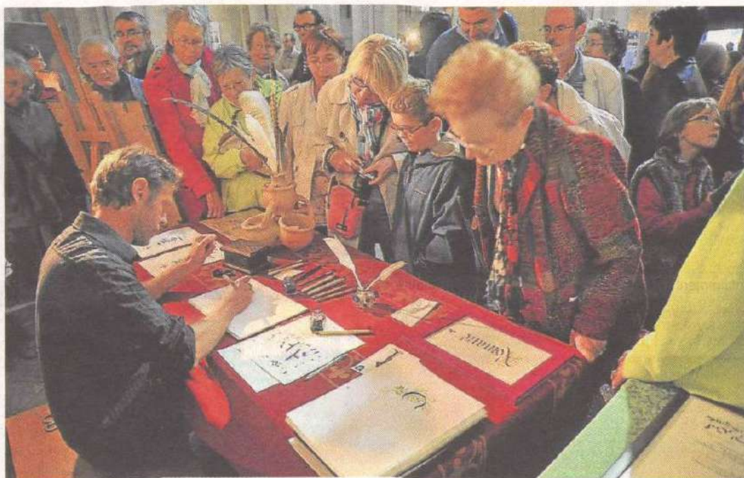
Le public s'est pressé nombreux aux dernières journées Mans'Art.

Autre curiosité, l'association les Voix de la Forge, qui restaure l'ensemble des ferronneries du passage