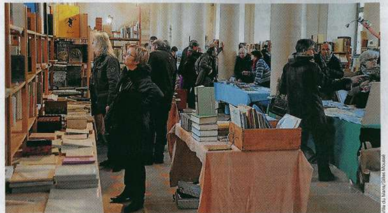
Le salon du livre ancien avait connu un grand succès l'an dernier à l'abbaye Saint-Vincent. Il est reconduit ce week-end avec une vingtaine d'exposants.

Sur ce même square du cœur de la vieille cité, sera réuni un bel asser-