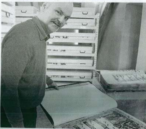
Toutes les letrines sont habillées de personnages étranges, de magnifiques dessins illustrent les certaines de pages comme l'annonciation par exemple.

Chaque volume ne pèse pas moins de 35 kg et mesure 72 cm de haut. Ils contiennent les chants de messe grégoriens pour la célébration des