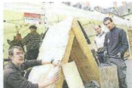
Parmi les artisans installés au pied de la cathédrale, des spécialistes de la restauration de charpente ancienne, de couverture du patrimoine ancien...