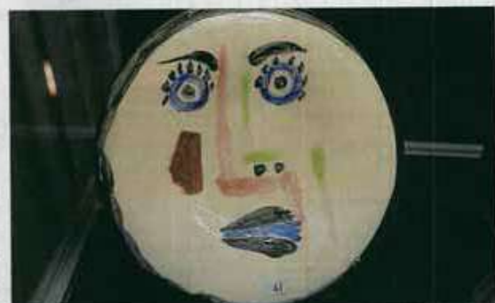
L'assiette signée Pablo Picasso a fait monter les enchères.

À l'occasion des journées Mans'Art, une vente aux enchères était organisée collégiale Saint-Pierre-la-Cour en début d'après-midi hier. Une première pour cette manifestation. Trois commissaires-priseurs présentaient des tableaux, des grands crus, des objets militaires, des gravures, des poteries... La plus forte enchère revient à une assiette éditée par Madoura, dotée d'un dessin de Pablo Picasso, réalisée dans les années 50-60, et mise en vente par Me Sanson. Six lignes téléphoniques avaient été ouvertes pour gérer ces enchères. L'assiette a été vendue 6 000 € (7 500 € quand on ajoute les frais).