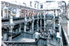
Le duo travaille aussi sur la restauration des rambardes et luminaires du passage Pommeraye à Nantes.

Ciseleur en Loire-Atlantique, il s'apprête – à son tour – à passer le flambeau à Élisabeth Brault, son apprentie. Une transmission rendue possible grâce à l'action de la Fondation du patrimoine.