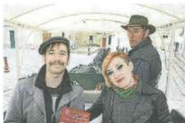
Gorgia l'Italienne et Savaldore l'Espagnol ont choisi l'une des quatre calèches gratuites pour déambuler de site en site.

Tout le programme sur www.lesjoursmansiart.com/